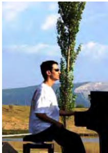
Tigran Hamasyan in Serres

Tigran's talent as a jazz pianist was first revealed in 2000 at a Jazz Festival in Yerevan. In 2003, he won first prize at the Juan-les-Pins competition in the instrumental jazz category, so this 17-year old is well on his way to go to the top of his profession. In his first album, Introducing Tigran Hamasyan , he shows a real maturity as a jazz pianist with his very own style which owes much to the influence of predecessors such as Bill Evans and Keith Jarrett, and to the sound of his home country.