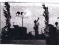
"Blue Buëch" a tout mis en œuvre pour faire apprécier cette musique universelle.

Deux jours, deux auras, deux rythmes de jazz. Concerts au Théâtre de verdure de la Germanette, animations... "Blue Buëch" a tout mis en œuvre pour faire apprécier cette musique universelle.